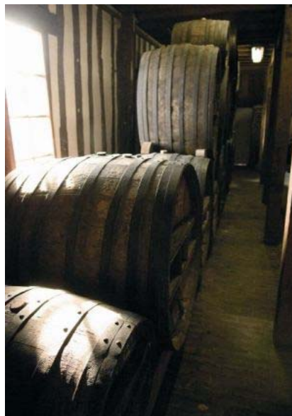
Cantina di affinamento